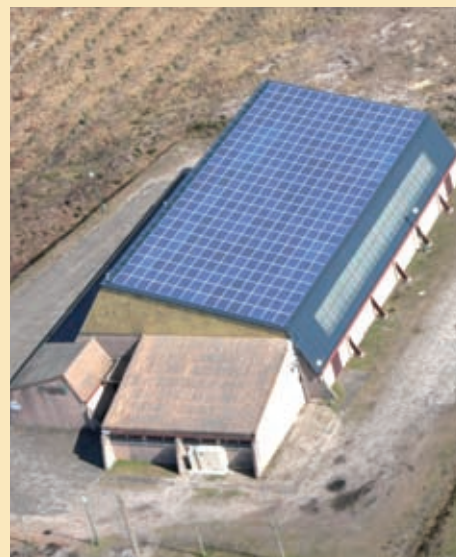
Le toit du gymnase intercommunal vu du ciel. Une couverture impressionnante de panneaux photovoltaïques

semestre 2011 entraînera la fermeture du gymnase de juillet à septembre.