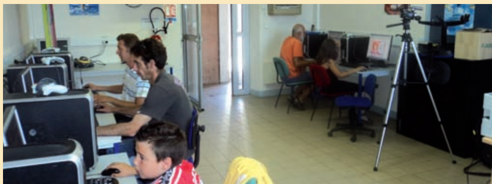
Des équipements utiles à tous

Vous n'avez pas d'ordinateur chez vous mais vous devez faire un courrier ou un CV ? Vous êtes équipés mais vous voulez apprendre à mieux utiliser les programmes ? Ou vous souhaitez simplement vous initier à l'informatique pour peut-être vous équiper prochainement ?