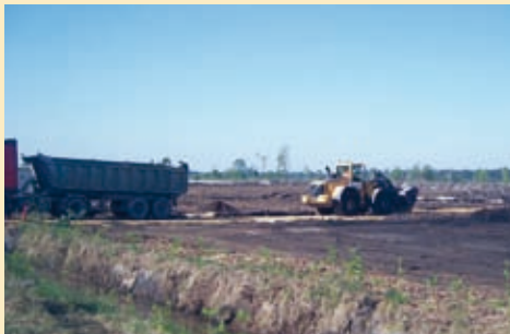
La zone de Solférino en cours d'aménagement pour recevoir entre 360 000 et 500 000 tonnes de pins.