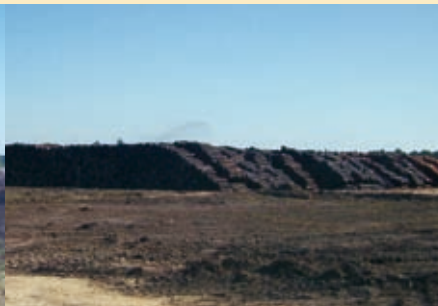
Commensacq : 300 000 m 3 de bois pourront être stockés