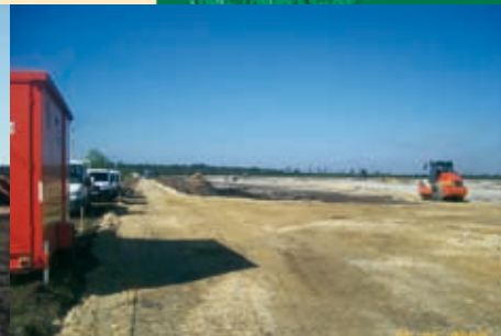
Zone de Labouheyre : objectif de 200 000 m 3