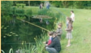
Les fêtes à Commensacq, ont eu lieu du 20 au 24 mai avec, notamment, le concours de pêche pour les enfants.