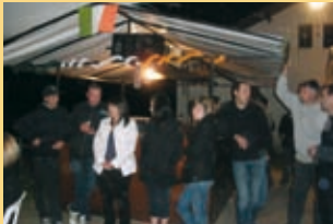
Les fêtes de Trensacq se sont déroulées du 24 au 26 avril